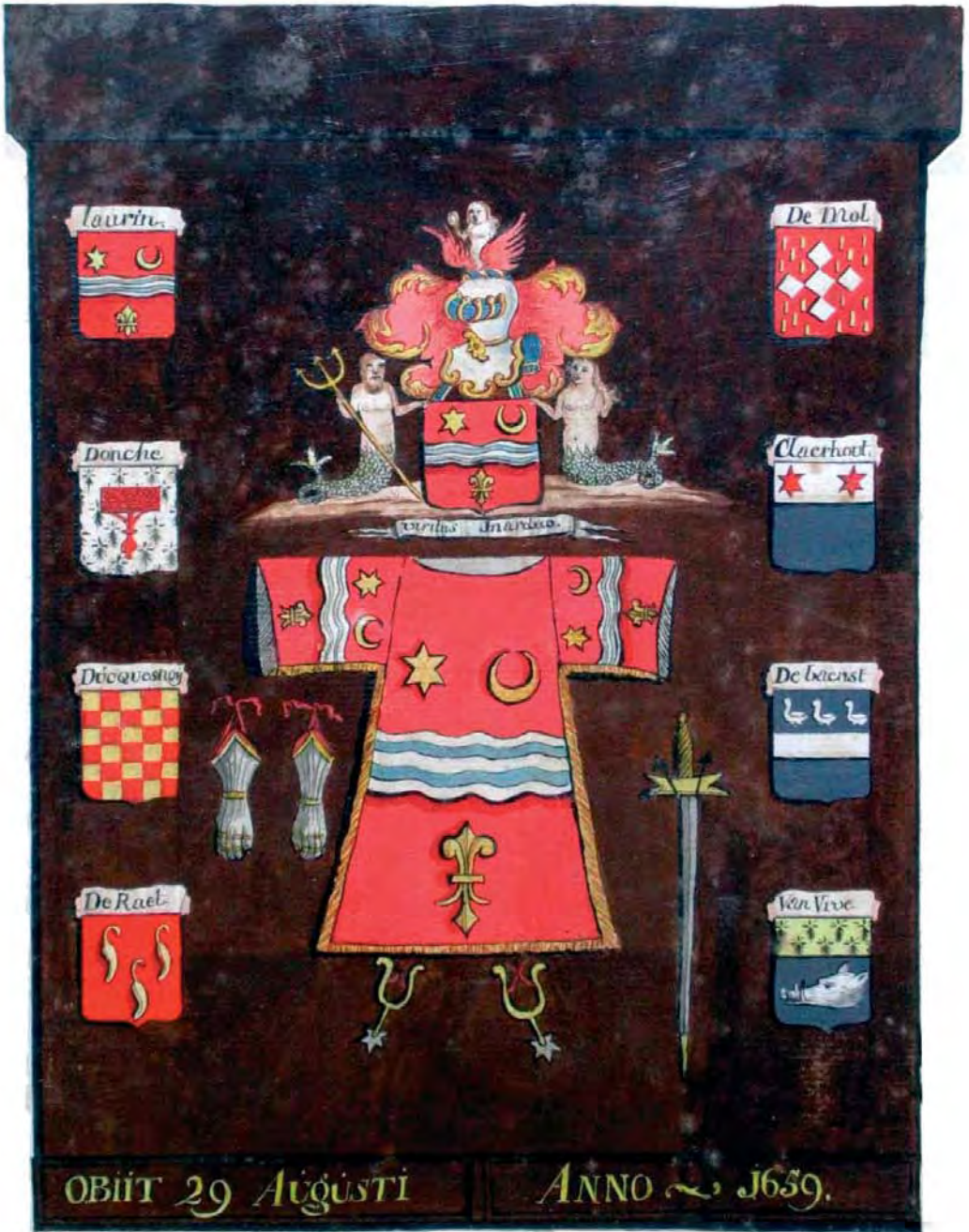
Het wapenkabinet Laurijn, eertijds in de Brugse Sint-Jacobskerk.